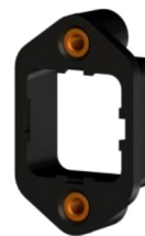
Snapfit Einbaurahmen INT nur für MLI-6015 Material Polyamid, Art.Nr. 2000791