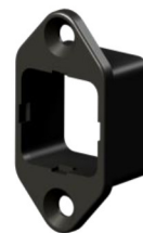
Snapfit Einbaurahmen EXT nur für MLI-6015i Material Polyamid, Art.Nr. 2000790